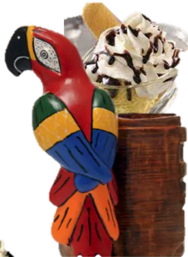
Chocolat Liégeois 7,80 € 2 b chocolat, chocolat chaud, chantilly