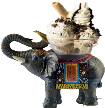
Dame blanche 7,80 € (2 b vanille ,chocolat chaud, chantilly)