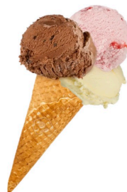
2 boules 5,50 €