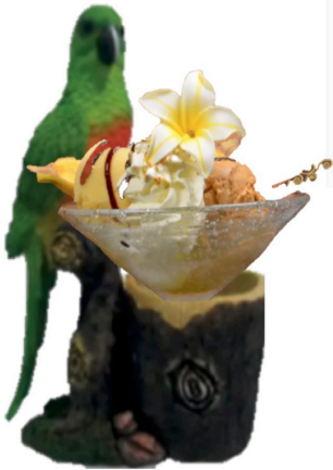
Colonel 8,80 € ( 2 b citron, 4cl vodka)