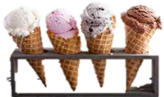
3 boules 8,20 €