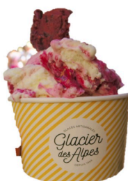
1 boule 3,00 €