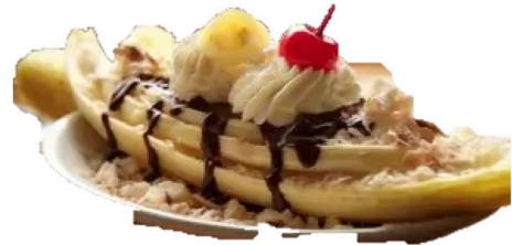
Banana-split 8,90 € banane - 3b fraise - chocolat - vanille chaud - chantilly